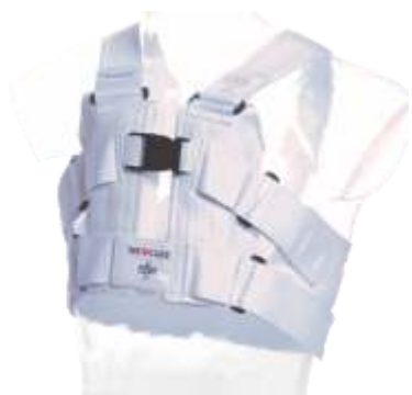
Chaleco de apoyo esternal POSTHORAX®

Determinar el talle: con una cinta métrica, comience a medir desde la espalda, por debajo de las axilas, hasta la parte superior del tórax. Si la medida se toma por el abdomen, o en las mujeres, por el busto, se obtendrá un talle incorrecto.