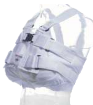
Chaleco de apoyo esternal POSTHORAX® con sostén